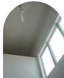
太陽の光が降りそぐ開放感たっぷりの吹抜け。