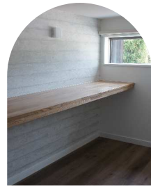
忙しいママに使い勝手の良いプライベート空間