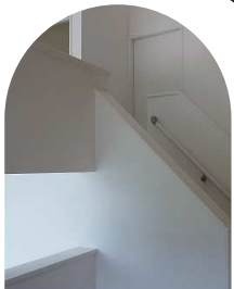
特別な空間、スキップフロアー