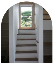
階段の踊り場にある素敵な窓